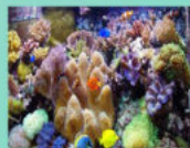
Eau de mer